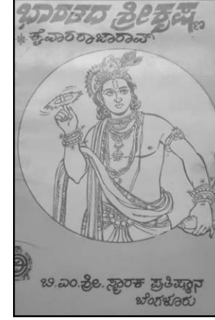
ಕೊಳಲಿಲ್ಲದ ಶ್ರೀ ಕೃಷ್ಣ

ಕಂಸನ ತಾಯಿ ಒಳ್ಳೆಯ ಚೆಲುವೆ. ಆಕೆಯಲ್ಲಿ ಕಾಮಗೊಂಡ ದುವಿಲನೆಂಬ ದುಷ್ಟನು ಅವಳ ಗಂಡ ಉಗ್ರಸೇನ ರಾಜನ ವೇಷದಲ್ಲಿ ಅವಳನ್ನು ರಮಿಸಿದ ಫಲವಾಗಿ