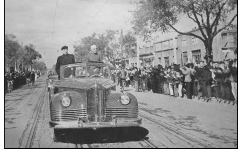
ಪಂಚಶೀಲ ಸೂತ್ರದ ಪ್ರತಿಷ್ಠಾಪಕರಾದ ನೆಹರೂ ಮತ್ತು ಪ್ರಥಮ ಅನುಮೋದಕರಾದ ಚೂ.ಎನ್.ಲೈ