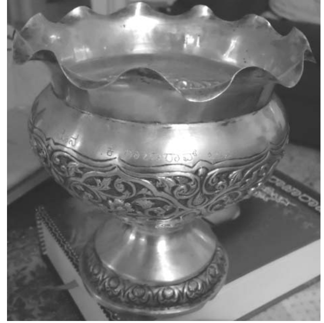
ದತ್ತಿ ಸ್ವರ್ಧೆಯ ಬಹುಮಾನ ಬೆಳ್ಳಿಯ ಕರಂಡಕ