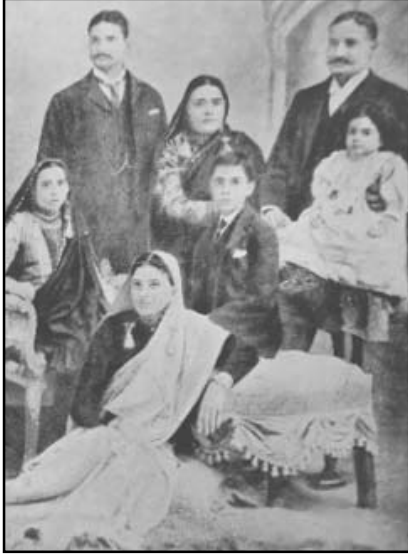
ನೆಹರು ಅವರ ಪರಿವಾರ