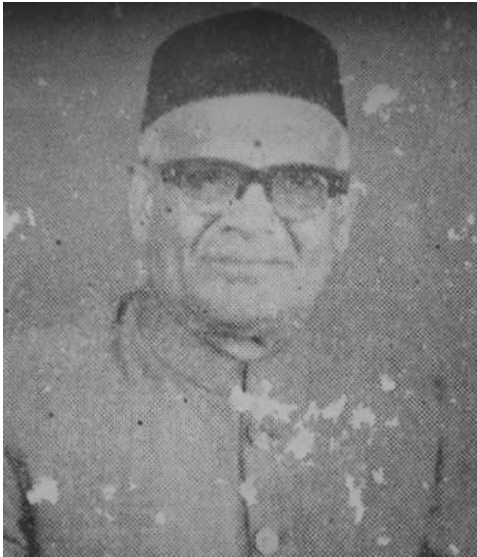
ರಾಜಾರಾಯರು ಸಾಂಪ್ರದಾಯಿಕ ಉಡುಪಿನಲ್ಲಿ