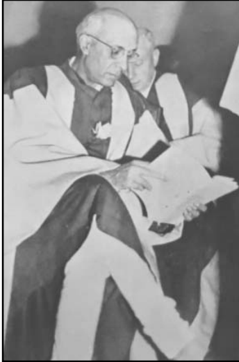
ವಿಶ್ವವಿದ್ಯಾಲಯದ ಉಡುಪಿನಲ್ಲಿ ನೆಹರು