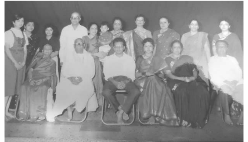
ರಾಜಾರಾಯರ ಮಕ್ಕಳು ಹಾಗೂ ಅವರ ಕುಟುಂಬ ವರ್ಗ