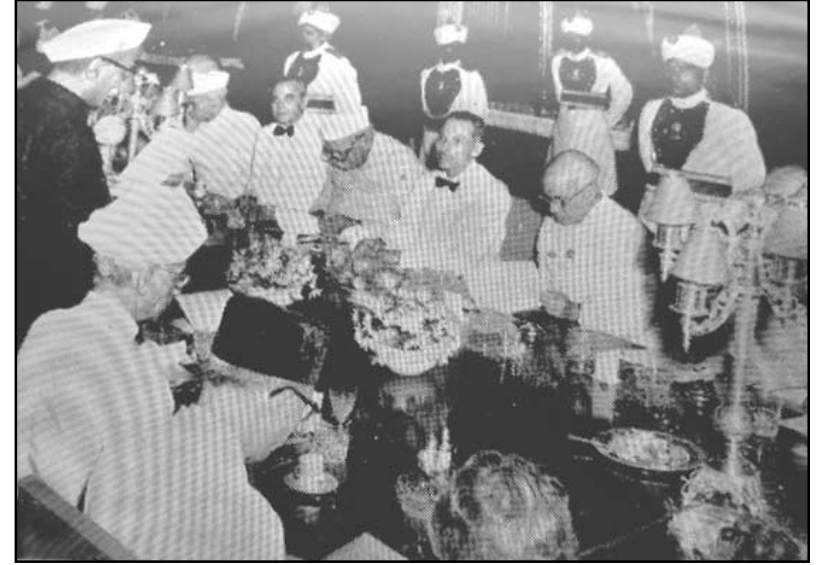
ಅಧ್ಯಕ್ಷ ರಾಜೇಂದ್ರ ಪ್ರಸಾದರು ರಷ್ಯಾ ಪ್ರವಾಸದಿಂದ ಹಿಂದಿರುಗಿ ಬಂದ ಜವಾಹಿರಲಾಲರಿಗೆ 'ಭಾರತರತ್ನ' ವೆಂಬ ಬಿರುದನ್ನು ಪ್ರಕಟಿಸುತ್ತಿರುವುದು.