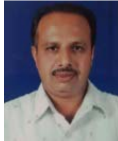
ಆಯುರ್ವೇದ ಡಾಕ್ಟರ್ ಹಾಗೂ ಲೇಖಕರು